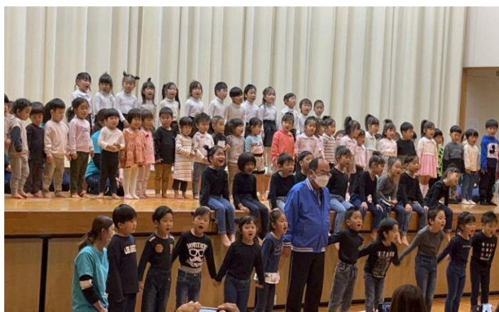
感動のフィナーレの合唱風景

12月16日(金)に行うもちつきに関しては、エプロン、三角巾を持たせてください。ご飯はいりません。